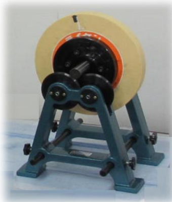
ローラー式バランス台