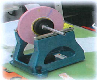
平行棒式バランス台