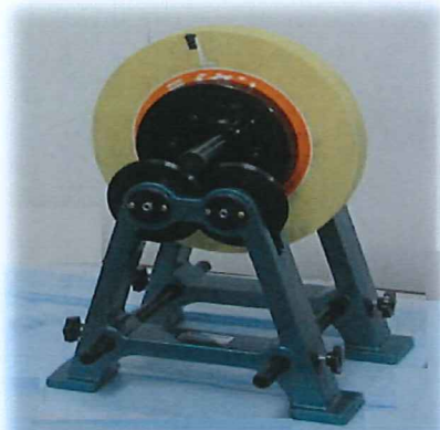
ローラー式バランス台